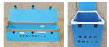
蛍光灯回収のボックス