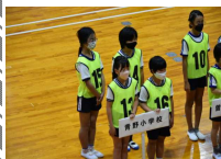
【自転車亀岡市大会】