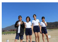
【京都丹波 キッズふれ あい駅伝】