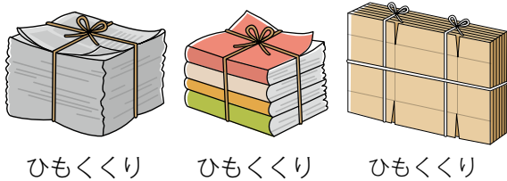
ひもくり ひもくり ひもくり