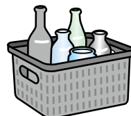
その他の色用コンテナ