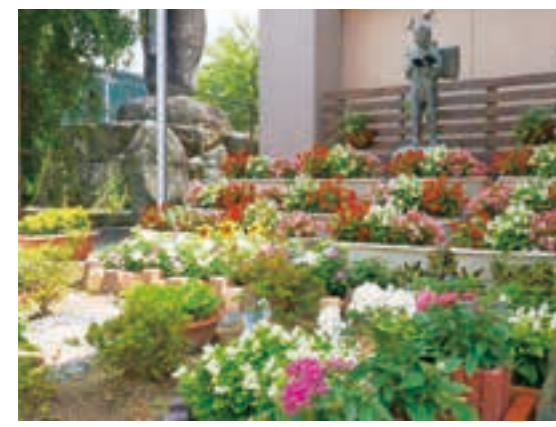
▲華やかなガーデニングが曾我部小学校の一角を彩る

私たちの身近にある学校は、持続可能な開発目標(SDGs)の達成に向けた重要な場所のひとつです。SDGsの17ある目標の一