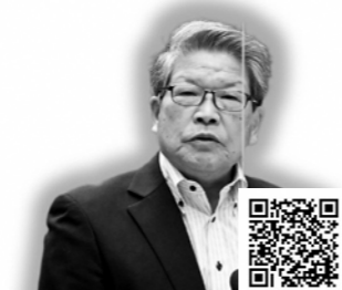
奥野 正三 議員