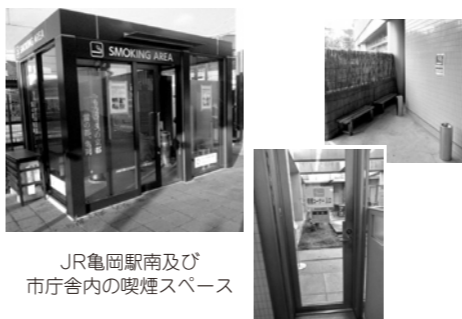
JR亀岡駅南及び市庁舎内の喫煙スペース

環境先進都市推進部長 馬堀駅では、現在工事を進めており、年内に完成する予定である。並河駅は令和5年度、千代川駅は令和6年度に設置する計画である。