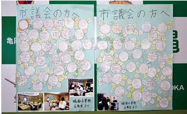
議長記者会見で使用するバックボード

今回初めて9月議会の一般質問を傍聴させていただきました。議会では、各議員から市民の目線で困り事に対する質問や要求が丁寧な語られました。答弁する側も誠実に返答されていました。私は、中学校給食の実施に関心があります。6年かけて準備する計画とされていますが、少しでも早く実施されることを望みます。給食費無料化についても、財源確保を検討すると答弁されました。今より、子どもからお年寄りまで安心して過ごせる市政になるとうれしいです。傍聴して、議会や市政に関心を持ち、住みやすく暮らしやすい亀岡市になればよいなと思いました。