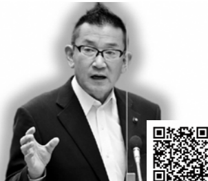
小川 克己 議員