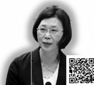
山本 由美子 議員

山本 近年、前立腺がんや膀胱がんの増加に伴い、男性で尿漏れパッドを使用する方が増えているが、使用済みパッドを捨てる場所がないため、持ち帰らざるを得ない状況が少なくない。