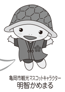
亀岡市観光マスコットキャラクター 明智かめまる