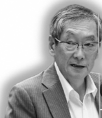
大塚 建彦 議員

大塚 「子どもファースト宣言」が行われた。子ども医療費の無料化と18歳まで対象拡大、保育園などで使用するおむつの提供と処理の無料化など、素晴らしい内容だが、市長はどのような思いなのか。