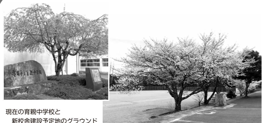
現在の育親中学校と 新校舎建設予定地のグラウンド

本梅・畑野・青野の3小学校と育親中学校を統合し、義務教育学校「育親学園」とする議案が賛成多数で可決された。