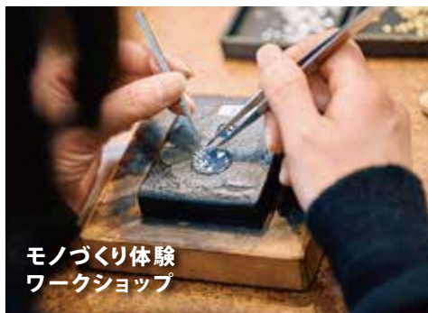
モノづくり体験 ワークショップ