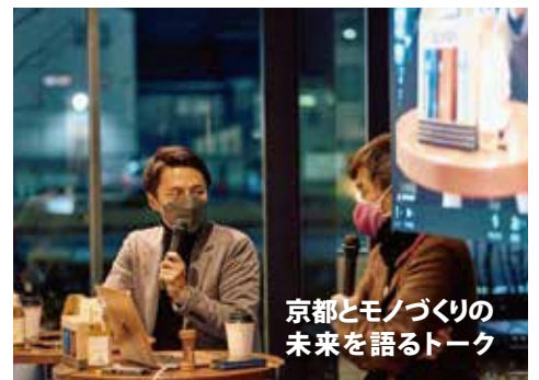
京都とモノづくりの 未来を語るトーク