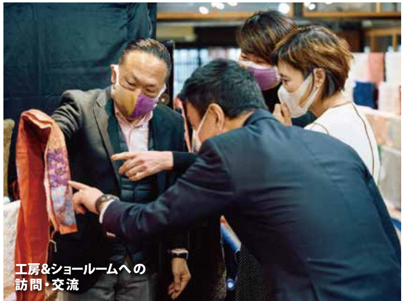
工房&ショールームへの 訪問・交流

会場は、京都全域に点在するさまざまなモノづくりの活動の現場（SITE）です。期間中にさまざまな場所に足を運び、ぜひ新しい体験や作り手との交流を楽しんでください。