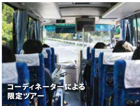
コーディネーターによる 限定ツアー