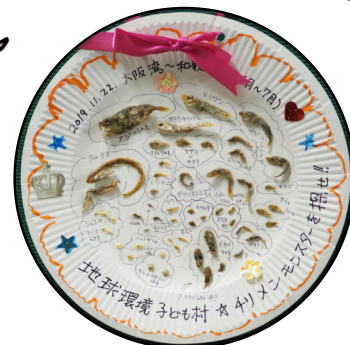
※夏休み特別講座での様子