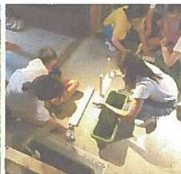
夏休み親子コンポスト教室