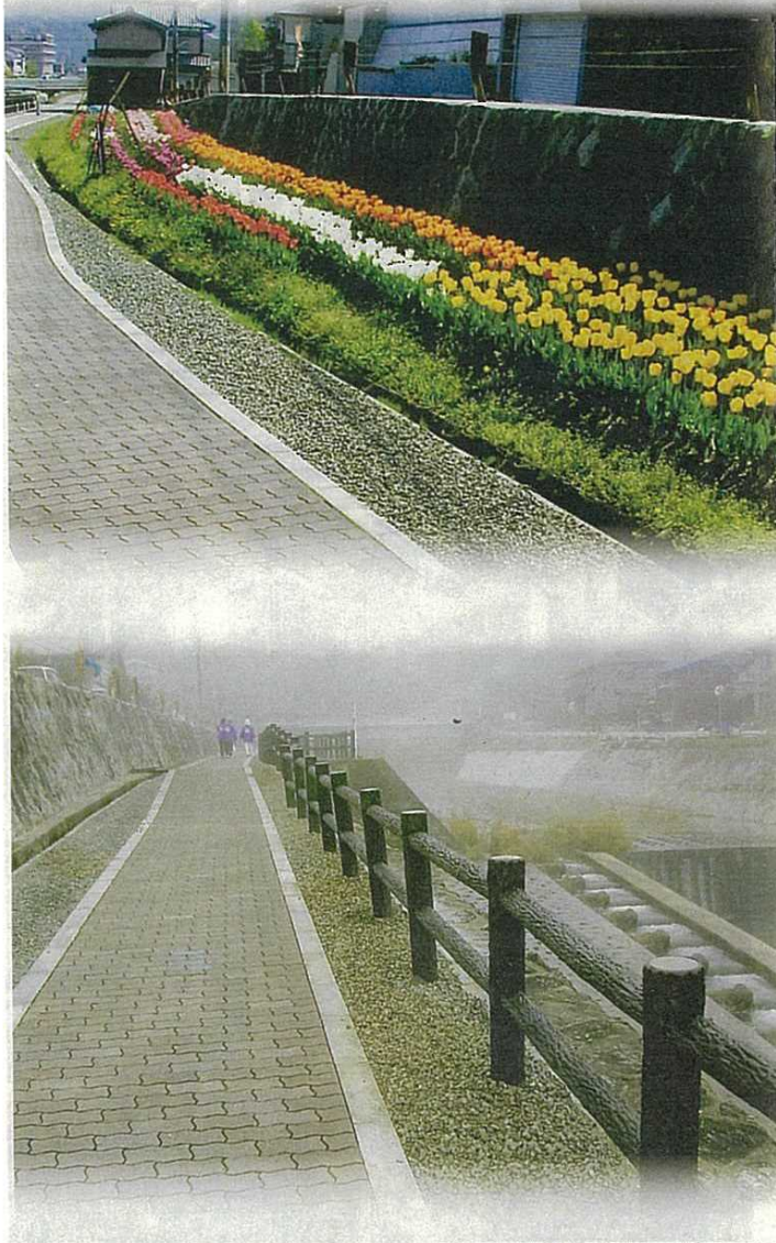
つつじヶ丘を美しくする会