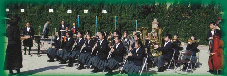
昨年の町民祭から