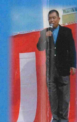
昨年の町民祭から