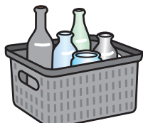
その他の色用コンテナ