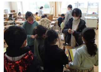
ハンドメイドクラブ