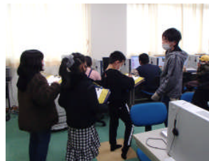
パソコン・サイエンスクラブ

1月27日に3年生がクラブの見学をしました。3年生は、メモ用紙にクラブの様子を熱心に書き留めていました。6年生は、3年生にクラブの活動内容を説明したり、質問に答えたりと最高学年として優しく丁寧に関わっていました。3年生は来年度のクラブ活動を楽しみにしています。