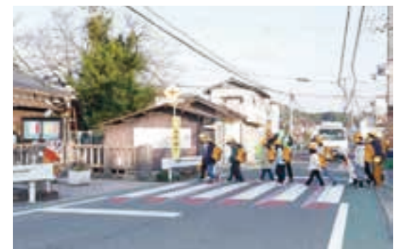
▲横断歩道の白線に茶色の影を付けて立体的に見せている

前回に続いて、亀岡の暮らしの中で見つけた「持続可能な開発目標(SDGs)」に関連する取り組みをご紹介します。まず、SDGsには「貧困をなくそう」