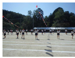
【色別全員リレー(3・4年)】