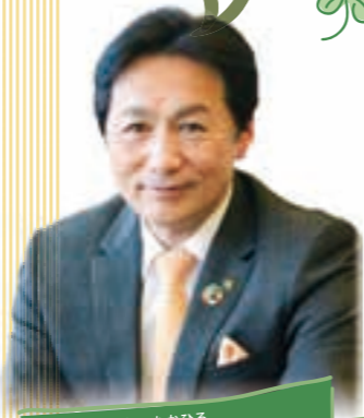
桂川 孝裕 市長

2020年7月、内閣府から「SDGs未来都市」に選定された亀岡市。SDGsのさらなる推進を目指し、市民の皆さんと協働で有機農業の普及に取り組んでいます。