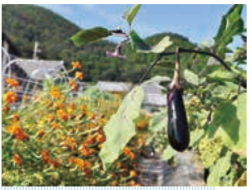
農薬を使わないため、マリーゴールド(写真左)など害虫を防ぐ花と一緒に植えています。

私自身、脱サラして農家になりましたが、有機農業を広めるためには新規就農者の獲得が重要です。本協議会でも今後、有機農業を志す人を受け入れてノウハウを提供し、新規就農者の育成につなげたいと考えています。