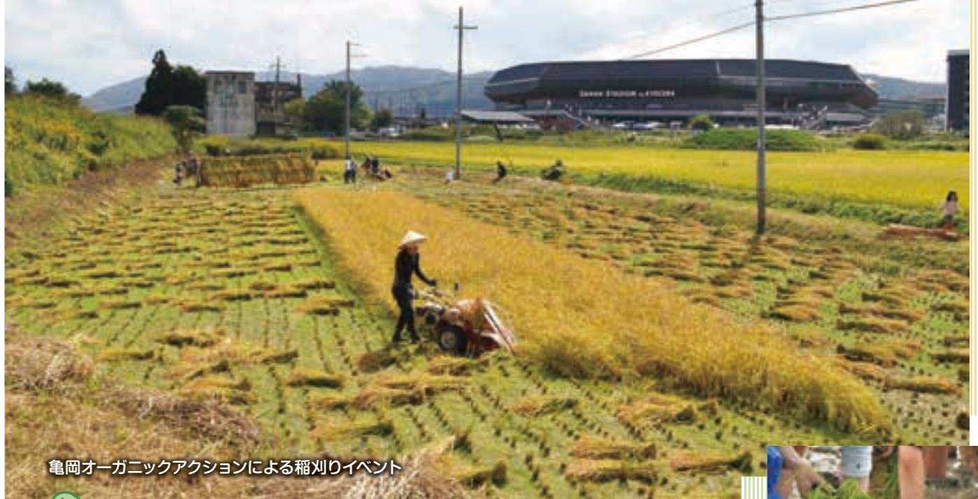
亀岡オーガニックアクションによる稲刈りイベント