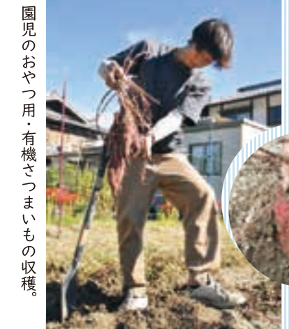
園児のおやつ用・有機さつまいもの収穫。

皆で広げよう有機の輪 10月10日、JR亀岡駅北側に広がる田んぼで稲刈りが行われました。これは、市民グループ「亀岡オーガニックアクション」が主催したもの。家族連れも参加し、6月に手植えた後、農薬や化学肥料を一切使わず育てた稲を収穫していきましました。 同団体は、「亀岡をオーガニックのまちにする」を合言葉に今年3月に結成。農家だけでなく、飲食業や旅行業に関わる人たちが、