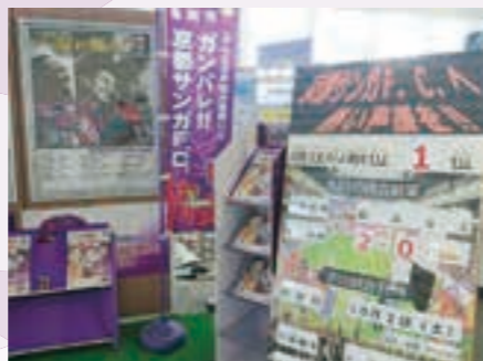
亀岡駅ではサンガポスターや試合結果看板など、立派なサンガコーナーが駅利用者を出迎えてくれます。