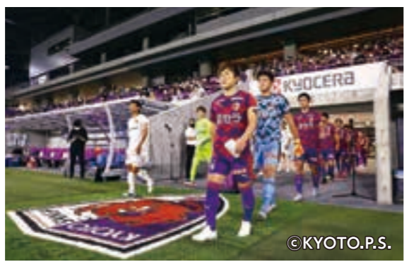
▲達成したい未来の姿をできるだけ具体的に設定することで、今何をやる必要があるか明確になる。

by KYOCERA で活躍している」といった具体的な姿を設定し、そこから逆算して、いつまでに何をしなければならぬかを考えるのです。 その際に、目標をぐっと高い位置に置くことがポイントです。圧倒的に高い目標を掲げることで、これま