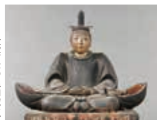
＜光秀後の亀山城主 羽柴於次秀勝坐像 (瑞林院所蔵)＞

TEL 22・0599 FAX 25・6128 E-mail kanebun.entry@gmail.com オンライン配信も行います。希望者はメールで申し込んでください。 (文化資料館)