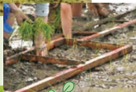
田植えイベント(6月)