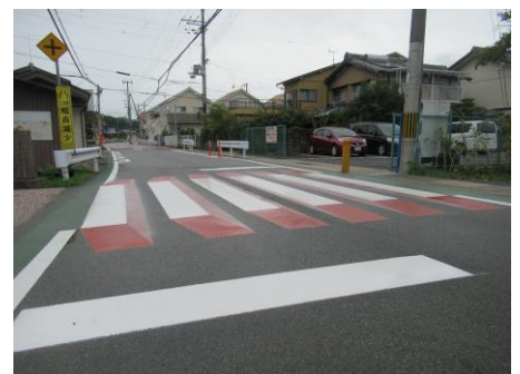
↑校門前の横断歩道

また、夏休み中に職員室の改築工事が終了しました。プール横の校舎増築工事については、来年の3月まで続く予定です。引き続き、ご不便をおかけすることもあるかと思ひますが、ご理解ご協力をいただきますようよろしくお願いいたします。