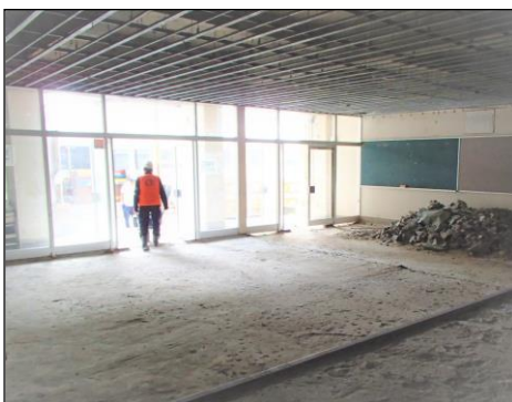
【解体された昇降口】