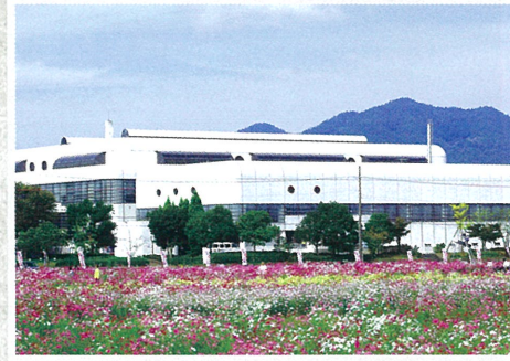
会場: 亀岡運動公園 体育館