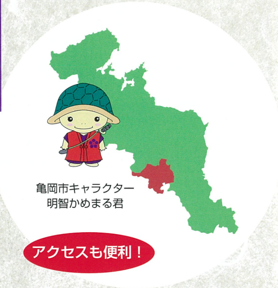
亀岡市キャラクター 明智かめまる君