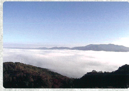
かめおか霧のテラス (雲海テラス)