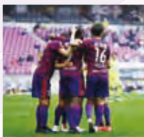
4月4日、雨の中行われた千葉戦で今シーズンのホーム初勝利。ここから15試合無敗を達成しました。

チームの充実ぶりを感じさせた前半戦、後半戦への期待は高まるばかりです。しかしチームの様子に慢心は感じません。目の前の試合に全神経を研ぎ澄まし、成長を続けるチームを皆さん全力でサポートしましょう!