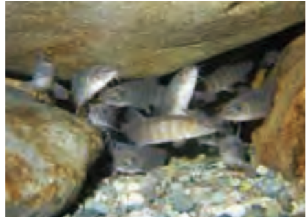
外来種による生態系への影響は、SDGsのゴール15「陸の豊かさを守ろう」に関係する

している外来魚「オクチバス」などが侵入し、「アユモドキ」が食べられてしまう可能性が指摘されています。