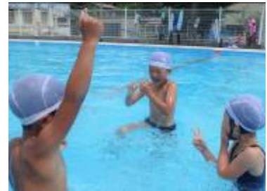
水中じゃんけんで大はしゃぎ

心待ちにしている40日間の夏休みが始まり、生活の場は、学校から家庭・地域に移ります。それぞれの家庭や地域の行事（お盆のお墓参りや夏祭り等）に積極的に参加をしたり、普段体験することのできないことへ挑戦したり夏休みだからできることを一つでも多く