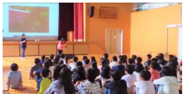
ぼちぼちさん 夏の読み聞かせイベント

最後に1学期間、教職員が子ども達の教育活動に専念することができましたのも、各ご家庭を始め、地域の皆様の温かい見守りと声かけのおかげであります。教職員一同、深く感謝を申し上げますとともに、子ども達にとって健康で安全、そして有意義な夏休みとなりますよう引き続き、目配り・気配り・心配りをお願いいたします。