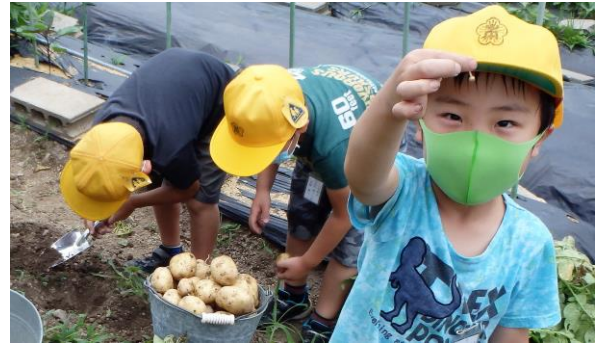
ジャガイモの赤ちゃん見つけたよ

ガイモの収穫時期を迎え、6年生は理科の実験に、1、2年生は森農園でイモ掘り体験をしました。