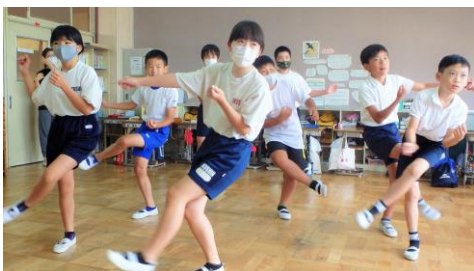
4・5年生に教えられるように練習を重ねる6年生

さて、高学年は「御神楽(みかぐら)」という岩手県から宮城県にかけて踊られている民舞に取り