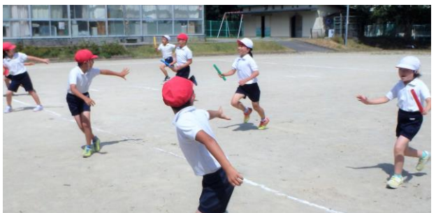
リードのタイミングを繰り返し練習する3年生

全員リレー 1～3年生と4～6年生の2レースを行います。バトンの練習も着々と進み、どんどん秒を縮めています。