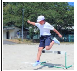
初めてハードル走に挑戦4年生

1～3年生は、複数の用具を使ってゴールをめざします。4年生以上はハードル走です。