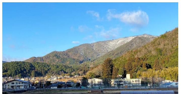
元旦にふれあいセンター・小学校・子ども園を望む 後ろには数掛山