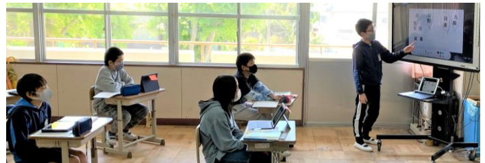
漢字の仲間分けで自分の考えを送って大画面で説明

また、他の学年でも、国語の授業でお互いの音読を撮影し、自分の動画を見ながら練習を重ねたり、体育のマット運動で互いの動画を撮り合い、スロー再生でチェックし練習に生かしたりしています。