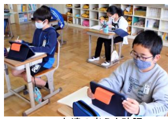
iPadで友達の考えを確認