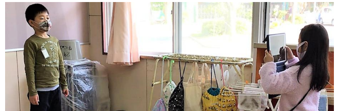
音読をお互いに動画で撮影

また、他の学年でも、国語の授業でお互いの音読を撮影し、自分の動画を見ながら練習を重ねたり、体育のマット運動で互いの動画を撮り合い、スロー再生でチェックし練習に生かしたりしています。