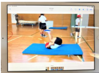
動画で手の付き方をチェック