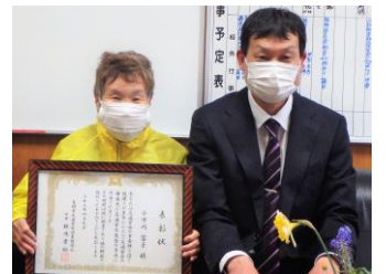
学校にも喜びをご報告