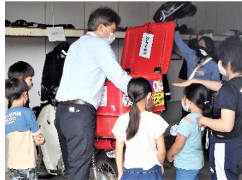
郵便局長さんによるバイクの説明

ほんめ戦隊ボウケンジャーこと2年生は、郵便局、駐在所、刀鍛冶やさんを探検しました。仕事の内容や道具、施設など様々な職業を知ることが将来の夢につながります。子どもを大事にくださる町内の皆さんにはいつも感謝です。