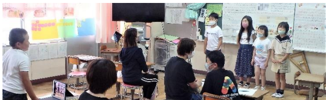
4年生 自然からくらしを守り隊発表会

さて、先週は久しぶりの土曜参観日でした。家の人を見つけるとますますがんばろうと張り切る1年生が本当にかわいらしいです。実は6年生だって心の中では同じです。2学期もできるだけみなさん誘い合って学校に来てくださいね。