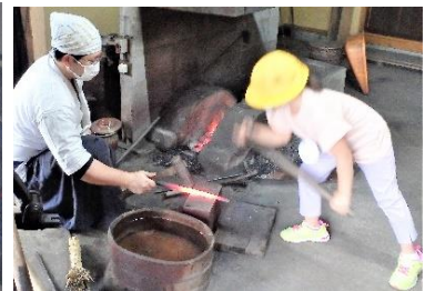
「鉄を鍛える」真っ赤な鉄をたたく体験