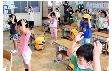
触って楽しく「ヘッド・ショルダ・ニー&ト」

3.4年生は週1時間、5.6年生は週2時間の「英語」を外国語支援員の先生にお世話になって進めています。そして、1.2年生もそれにつながる英語活動を始めています。