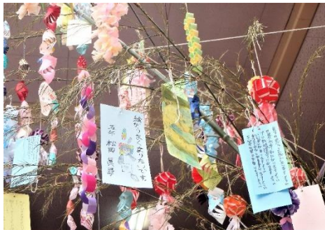
5mを超える七夕飾り ねがいがかないますように

竹！を準備してくださいました。ブックワールドは、みんなの願いが込められた短冊ときれいな飾りで七夕