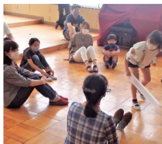
3年生 親子ゲーム大会