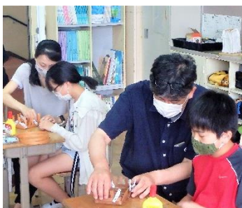
6年生 親子工作 紙かご作り

また、ファミリー活動は、相談する場や時間がない中で、役員さんを中心にうまく進めていただき本当にありがとうございました。