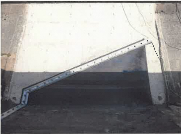
ゴム袋体 据付完了