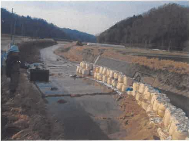
左岸側 既設ゴム堰撤去完了