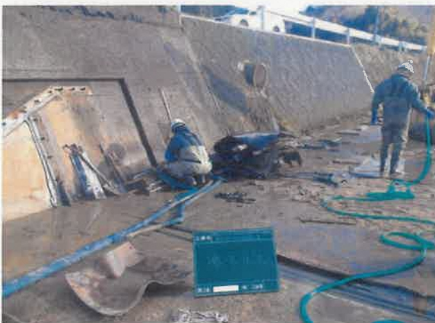
左岸側 既設ゴム堰撤去状況