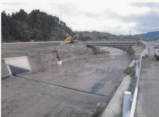
ゴム袋体 据付完了