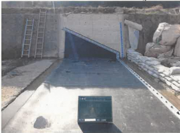
ゴム袋体 据付完了