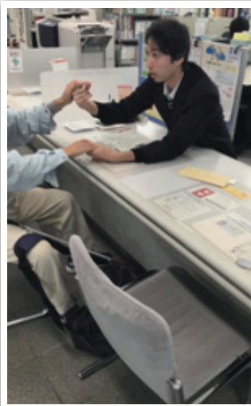
しゅくしゅわ まどぐちたいおう ようす 触手話での窓口対応の様子

かめおかし しゅわげんご およ しょうがいしゃこ み ゆ に けー 「 亀岡市手話言語及び障害者コミュニケーション条例 」の施行を受け、 亀岡市 では聴覚障がいのある市民の方々への コミュニケーション支援 を充実させるため、 手話通訳者 を正 きしよくいん さいよう げんざい しょうがいふくし 規職員として採用しました。現在、 障害福祉課 には 手話通訳資格 をもった職員が 3名 とな りました。