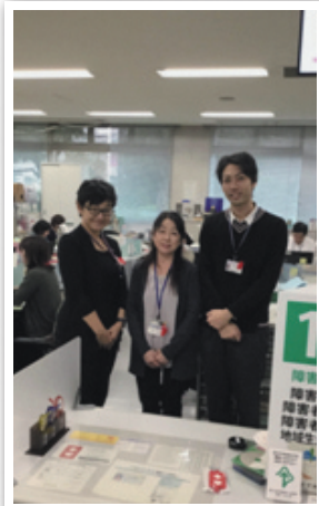
しゅわつうやくしかく しよくいん めい 手話通訳資格をもった職員3名

こんかい しょう ふくし に ゆーす つうやくしよくいん 今回の 障がい福祉NEWS では、 通訳職員 の ふだん ぎょうむ しょうかい おも 普段の業務についてご紹介したいと思います。