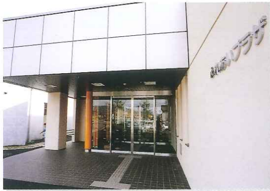
ふれあいプラザ正面玄関

少子・高齢化が急速に進むなか、生涯学習による市民の自主的な社会参加のもと、生涯を通じて心身ともに健やかで、生きがいのある生活を送ることは、すべての世代に共通する願いです。こうした中、全世代が交流し、個人として尊重され、ともに社会に参画し、世代を超えたふれあいによりお互いに支えながらいきいきと暮らせる市民参加のまちづくりを進めます。