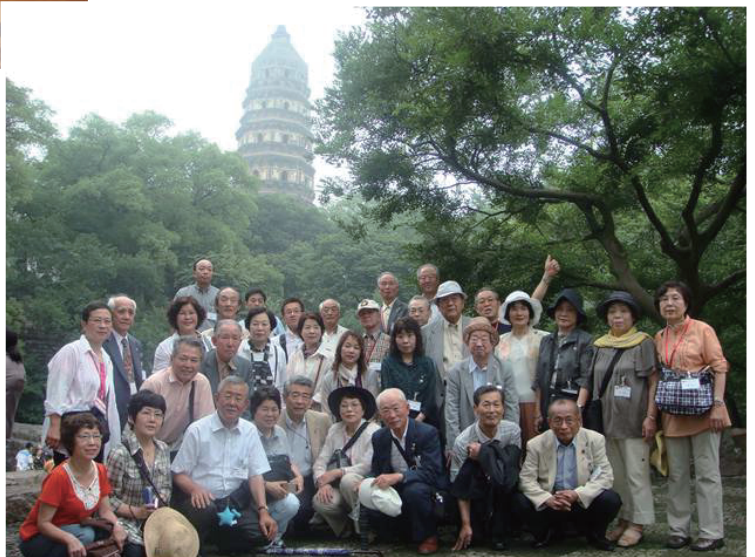
蘇州のシンボル雲岩寺塔を見学(虎丘にて) 参观(虎丘苏州的符号云岩寺塔)