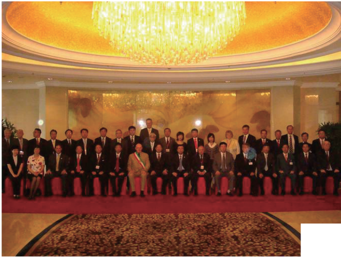
蘇州市國際友好都市事業 30 周年記念セレモニー 苏州市国际友好城市事业 30 周年纪念仪式