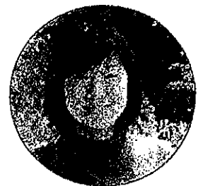
ひとつのおさら代表