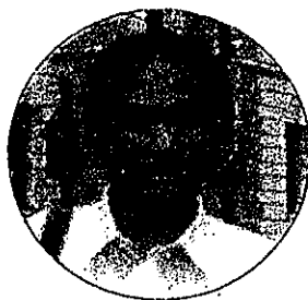
カッパ研究会世話人