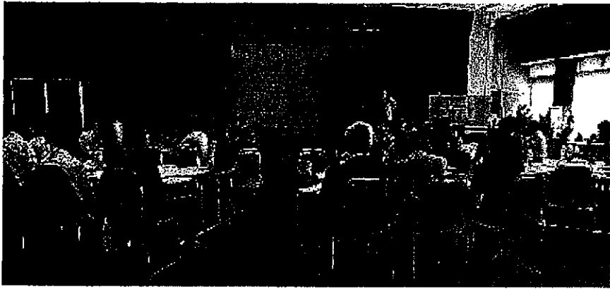
フォーラムの様子

●第1回NPO基礎講座は「NPO×ソーシャルビジネス」と題して、平成28年4月23日(土)午後1時半から、ギャラリーかめおか2階和室研修室で開催しました。