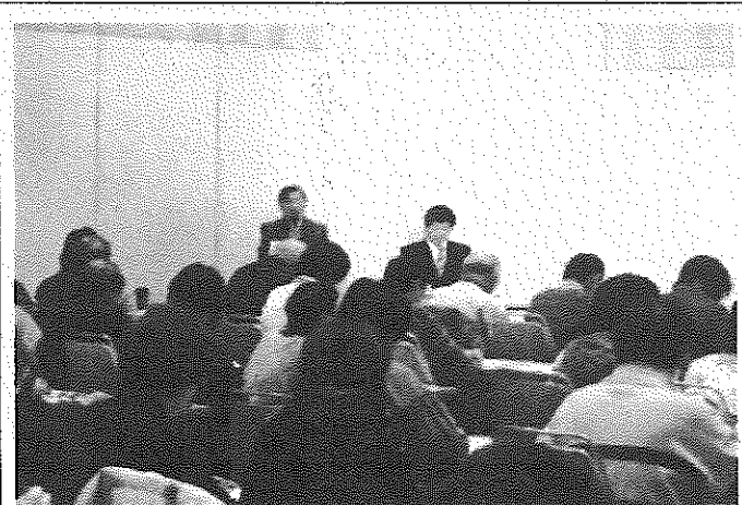
岡崎先生講演風景