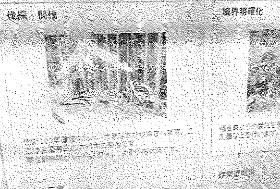
高性能機械を大木の伐採に活用している様子を紹介した美山町森林組合のホームページ

同振興局農林商工部によると、最大面積を占め、全国有数の大木産地として知られる。間伐材を資源化して森林所有者に収益を還元する取り組みを、2006年度から始めている。11年度から14年度にかけて、高性能林業機械を導入している。この結果、11人・3班による作業の労働生