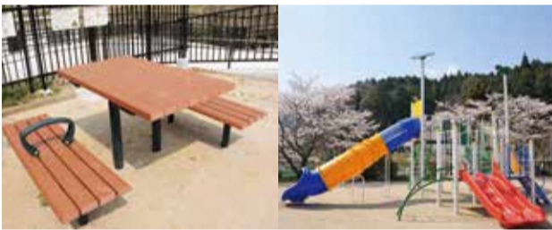
▲西別院町犬野児童公園に整備されたベンチ(左)、遊具(右)