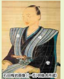
石田梅岩画像

貞享2(1685)年(江戸時代中頃)、現在の亀岡市東別院町東掛の農家に生まれた石田梅岩。律儀で厳格な父親の影響を受けて育ちました。青年期に「自分とは何か」「人間とは何か」「いかに生きるべきか」などについて真剣に考え、その答えを求め、仕事のかたわら勉学に励み、独学で研鑽を重ねたといわれています。 梅岩の絶え間ない学習意欲は成果として蓄積され、享保14(1729)年、45歳の時、「人の人たる道」の追求により人間の本性、心のあり方を集約し、念願の開講を実現。当時としては型破りの無料、出入り自由、性別不問の講義に人々は感銘を受けました。 60歳での没後も梅岩の教えは「石門心学」として受け継がれ、その志は生涯学習の原点として現代に生きています。