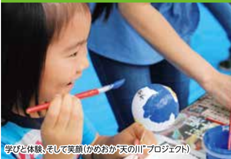
学びと体験、そして笑顔(かめおか「天の川」プロジェクト)

生涯学習とは、人々が生涯にわたり主体的に続ける学習活動のことです。亀岡市は、生きる喜びと明るく豊かなまちに住む喜びの持てるまちを目指し、昭和63年3月30日、全国の自治体に先駆けて「生涯学習都市」宣言を行いました。それから30年。平和で、未来に夢を描ける、誰もが住んでいることを誇りに思える「ふるさと亀岡」が市民の皆さんの参画と協働により醸成され、さらに広がりを見せようとしています。