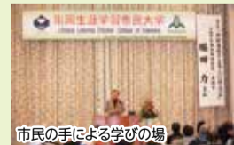
市民の手による学びの場