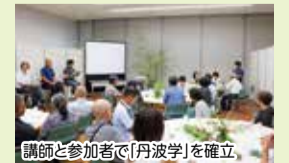
講師と参加者で「丹波学」を確立。

全国的・世界的な視野に立ち、各界で活躍される著名な学者、文化人を講師に招き、一般公開による自由聴講制で多くの市民の参加のもと開催しています。 受講生の中から運営委員を構成し、企画・運営に市民が主体に取り組むことで、「市民の、市民による、市民のための市民大学」を目指し開催しています。 さまざまな角度から講師と参加者が一体となって問題提起をし、人類的、地球的な広い視野から地域学としての丹波学を確立させることを目指します。