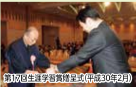
第17回生涯学習賞贈呈式(平成30年2月)