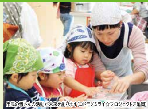
市民の皆さんの活動が未来を創ります(コドモミライ☆プロジェクト@亀岡)