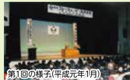
第1回の様子(平成元年1月)