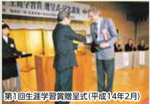
第1回生涯学習賞贈呈式(平成14年2月)

亀岡市の「生涯学習都市」宣言の基本理念を広く内外に発信する制度として、平成13年度に「生涯学習賞」を設立しました。この賞は、生涯学習の推進、男女共同参画社会の発展、環境と人間の共生、地域に根差した活動などで著しい功績のあった個人・団体・グループに送られ、生涯学習大賞「石田梅岩賞」、生涯学習ゆう・あい賞「千登三子賞」、生涯学習共生賞「上田正昭賞」、生涯学習奨励賞が設けられています。