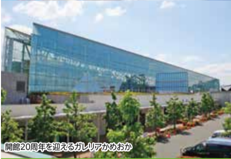
開館20周年を迎えるギャラリーかめおか