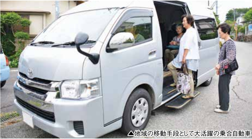
△地域の移動手段として大活躍の乗合自動車

また、同町において、夜間における安全性の向上と犯罪の抑止力として、主要道路や町内各地をカバーする場所にLED照明一体型防犯カメラの設置により、さらに明るく安全なまちになることを期待しています」と話されました。 亀岡市は今後も、地域が主体となった取り組みを支援するとともに、誰もが安全で、安心して暮らせるまちづくりを進めてまいります。