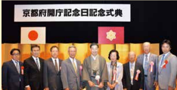
▲受賞を祝い山田知事らと記念撮影

これは、環境保全活動や環境保全行政の推進に顕著な功労があった人や、団体に對しその功績をたたえ京都府が表彰するものです。保津町自治会は、国の天然記念物であるアトロールや、産卵・成育環境に配慮した営農活動の継続など、クリー