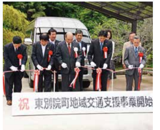
▲記念式典でテープカット