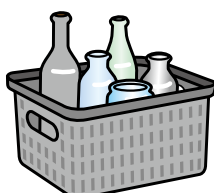
その他の色用コンテナ