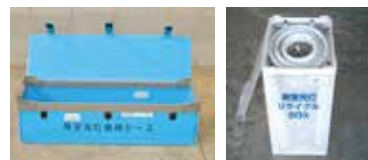
蛍光灯回収のボックス