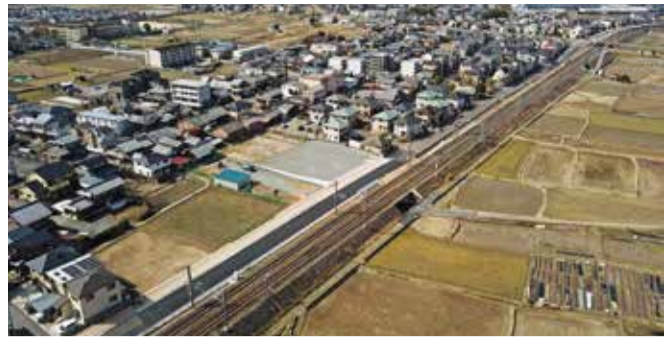
▲JR嵯峨野線に沿って駅を結ぶ市道北古世西川線(線路左側)

JR 亀岡駅周辺と馬堀駅周辺を結ぶ重要な道路として、市道北古世西川線(総延長1.5キロメートル)が3月30日から全線開通しました。同市道は、平成19年度から整備を開始し、地権者や地域住民の皆さんのご理解とご協力をいただきながら工事を進めてきました。JR 亀岡駅から馬堀駅の間は、これまで宅地開発で開通した道路が点在している状態でしたが、同市道の全線開通により車両の円滑な通行が可能となります。また、歩行者の安全確保のため、歩道付きの安全・安心なバイパス道路として整備しています。