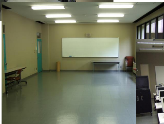
●202～203(大教室) 約 20 名 語学講座、体操講座などに使用しま す。