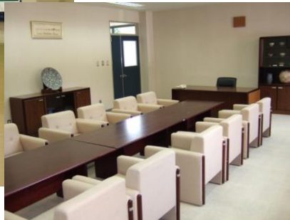
●会議室 16名 会議、控え室として使用します。