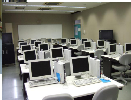
●コンピューター室 20 名 コンピューター講座に使用します。