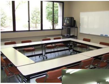
●201(小教室) 10名 会議、各種講座に使用します。