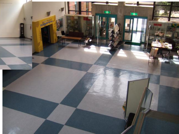
●エントランスホール イベント会場、レセプション、パーティ ーなどに使用します。