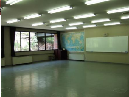
●実習室 80名 大規模会議、集会場として使用します。