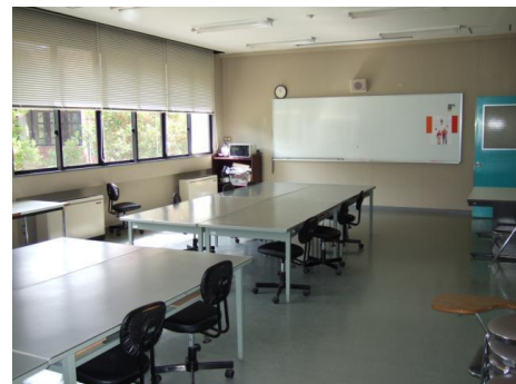
●206～207(大教室) 約 20 名 工作、工芸講座などに使用します。