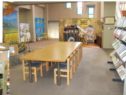
●ディスカバリールーム 主に地球環境子ども村の自然活動に 使用します。