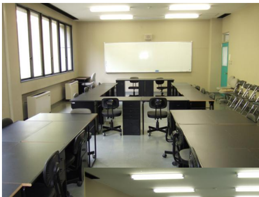
●204～205(大教室) 約 20 名 会議、研修などに使用します。