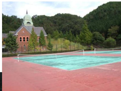
●グラウンド・テニスコート グラウンド、テニスコートは、(財)亀岡市体育協会が運営しています。 (電話) 0771-24-8385