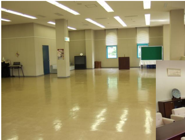
●イベントホール 音楽、その他各種イベントに使用します。